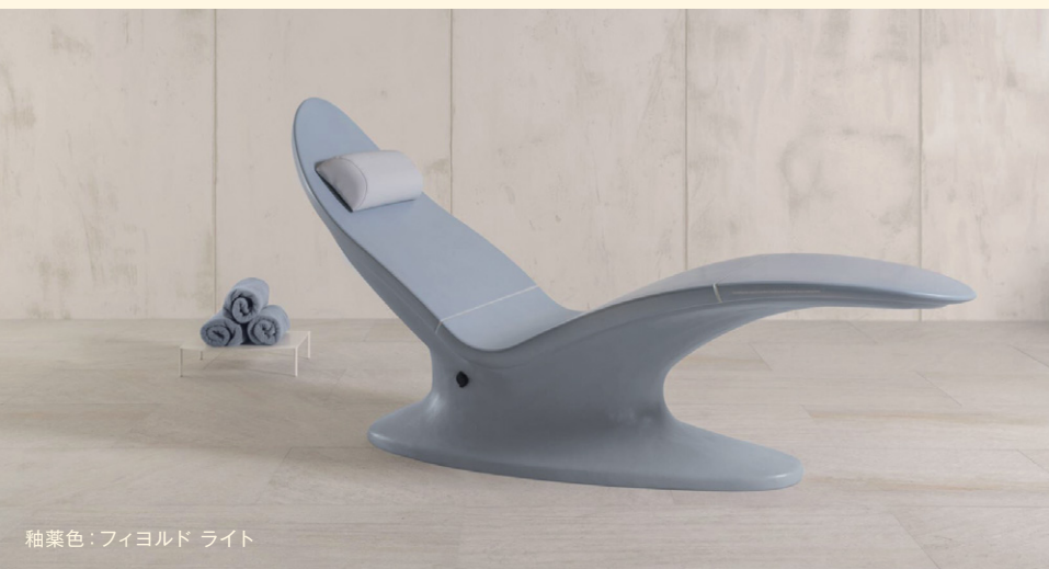
釉薬色：フィヨルド ライト