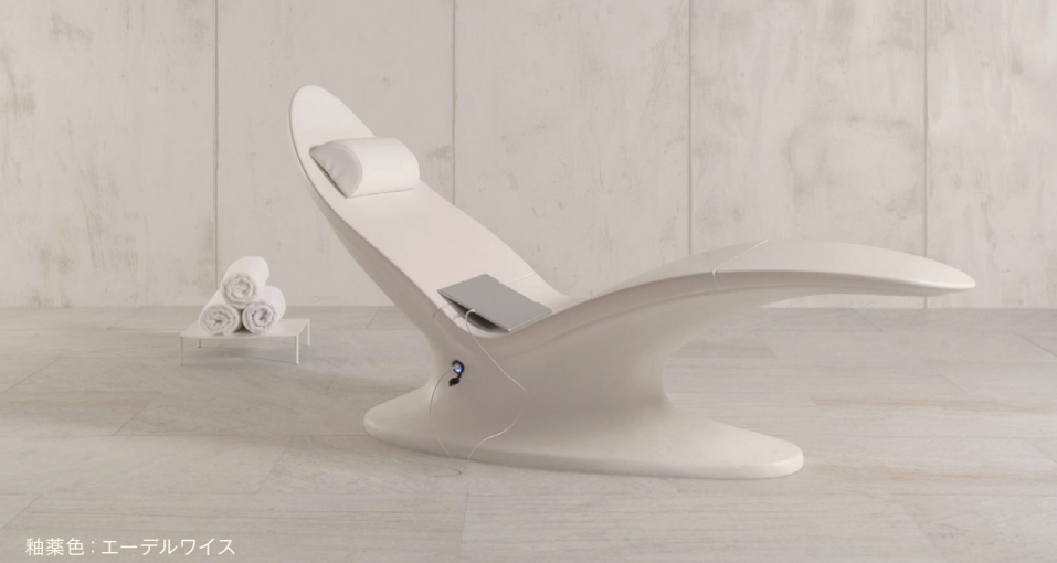
釉薬色：エーデルワイス