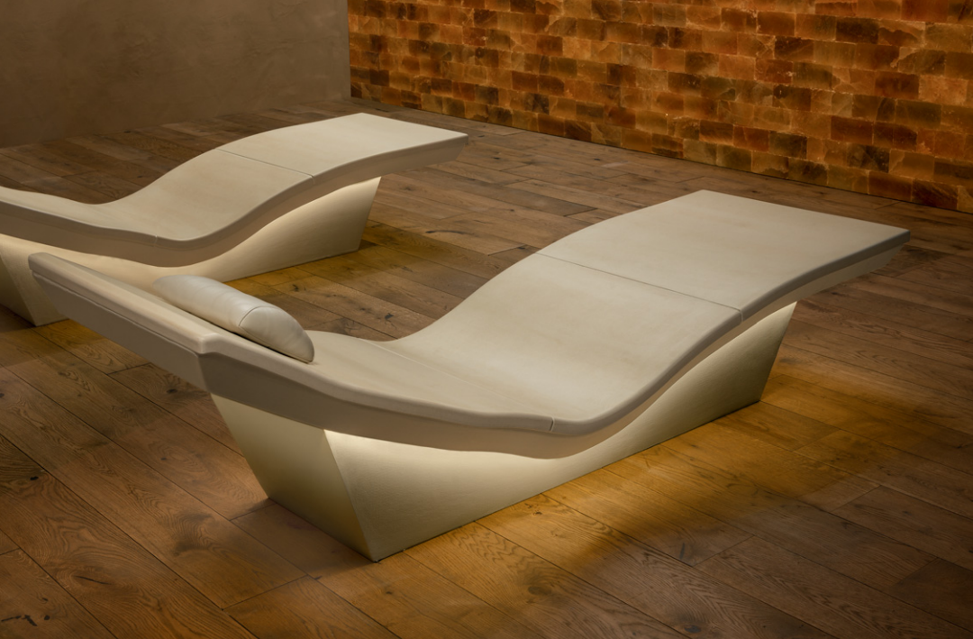
釉薬色：サバンナ ライト