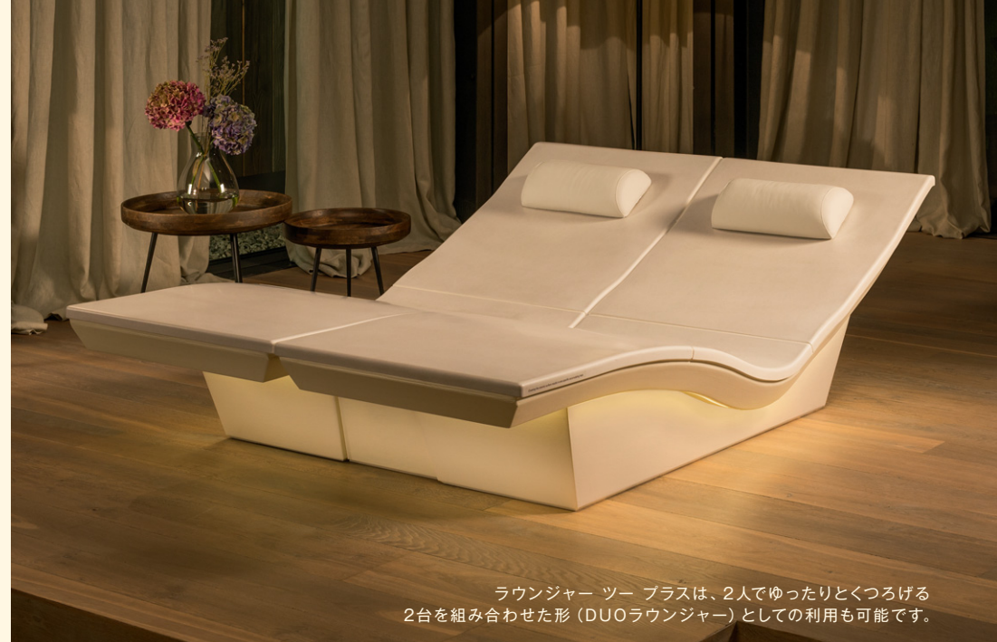
ラウンジャー ツー プラスは、2人でゆったりとくつろげる 2台を組み合わせた形（DUOラウンジャー）としての利用も可能です。